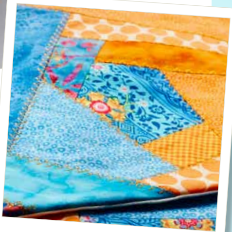
Honderden steken om uit te kiezen!

De automatische draadafsnijder snijdt het garen af en trekt de uiteinden naar de onderkant van uw stof.