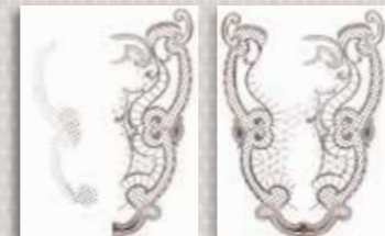
Originele spoel. DESIGNER EPIC™-spoel.