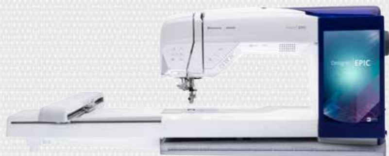
Ontworpen en ontwikkeld in Zweden - MADE FOR SEWERS, BY SEWERS™.

Of u nu naait, borduurt of quilt, de DESIGNER EPIC™ helpt u om uw grootste creatieve ambities waar te maken. We hebben de meest technologisch geavanceerde machine ontwikkeld die toch het meest eenvoudig te bedienen is, inclusief: